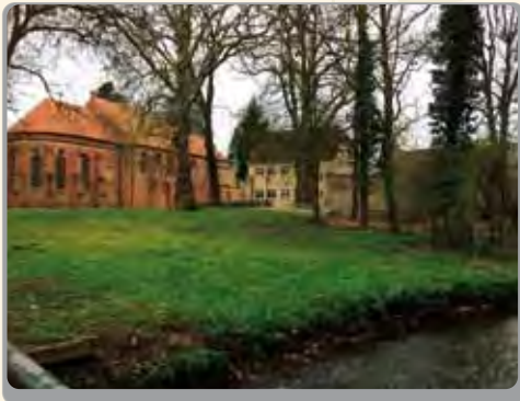
Hörstation 2 – An der Stepenitz

The audioguide is available in German and English may be acquired for a fee (5,00 €) at the hotel's administration office.