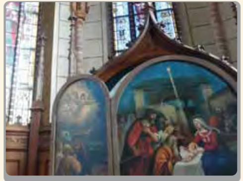
Hörstation 3 – Kirchenschiff